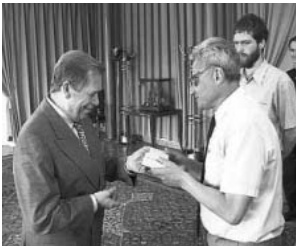
На Пражском международном фестивале документальных телефильмов «Единый мир» фильм «Страх. Репортажи из центра Европы» (автор Л. Миндлин, оператор В. Андронов) был удостоен Гран-при.

вы знаете о тоталитарных режимах, о том, что дремлет внутри общества и какая снежинка может привести в движение лавину?»