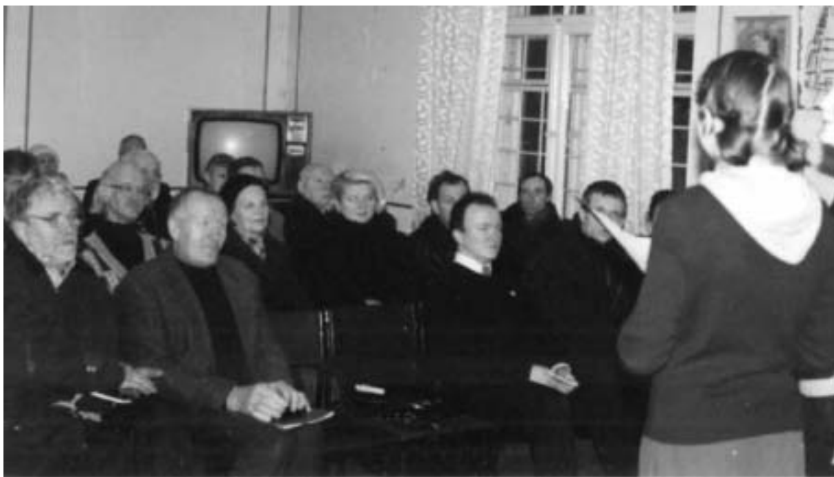
Паседжанне ТБК. 2000 г.

Па-другое, розныя погляды на сітуацыю ў беларускай супольнасці Літвы вызначаюць і розныя алгарытмы паводзінаў асобных лідэраў. Адны, што называецца, «ідуць у людзі». Іншыя бачаць сваё прызначэнне найперш у падтрыманні высокага інтэлектуальнага ўзроўню зладжаных імі імпрэзаў і сацыяльнай адказнасці за Баць-