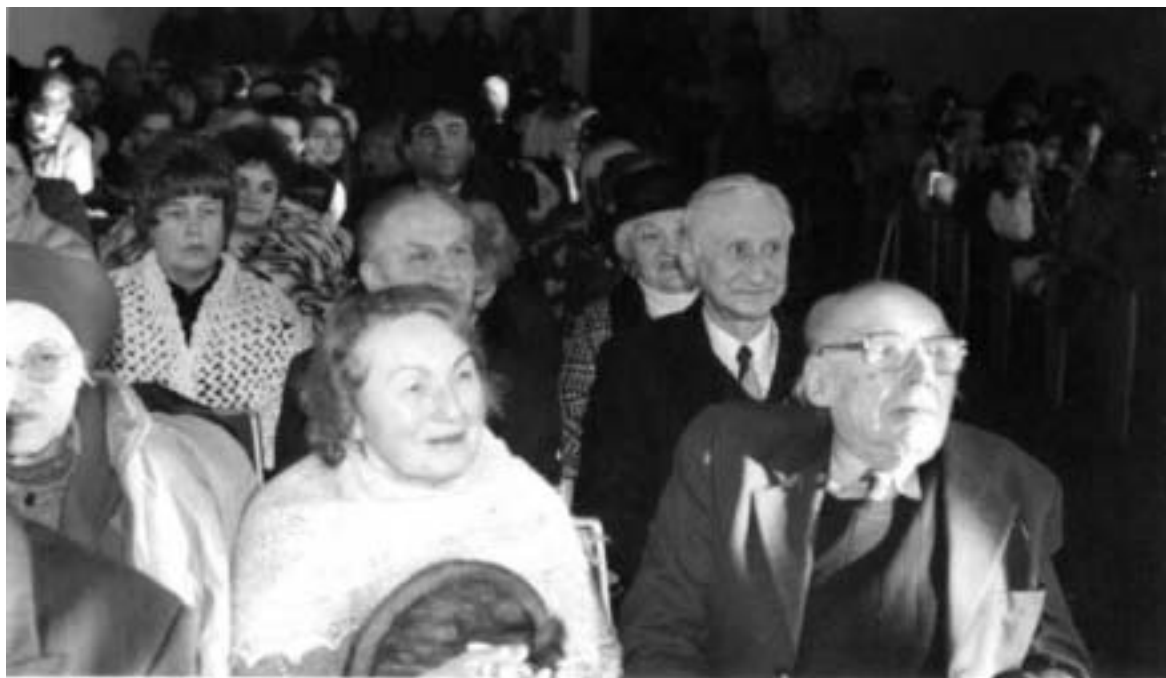
Дзень беларускай гімназіі. 2004 г.

нацыянальных меншасцей і эміграцыі, амбасады Беларусі ў Літве і літоўскай адміністрацыі ў рэгіёнах. Актыўны ўдзел у імпрэзах бяруць самадзейныя выканаўцы з зямляцкіх абшчынаў усёй Літвы, і кожны год святы ладзяцца ў іншым горадзе: у