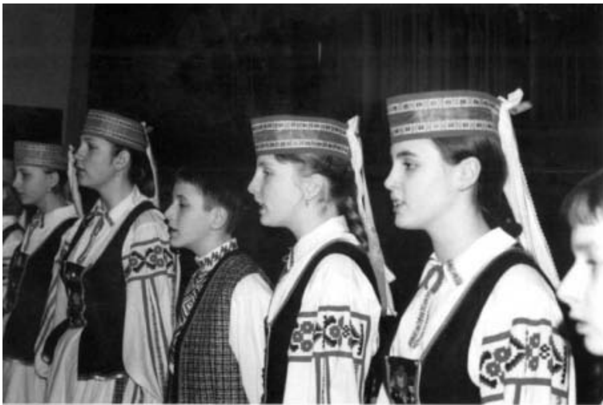
Ансамбль «Спадчына». 1998 г.

Складаная гісторыя рэгіёна, вызначаная сутыкненнем каталіцкай і праваслаўнай цывілізацыяў і перакрываваннем тут вялікіх геапалітычных інтарэсаў, робіць яго ўнікаль-