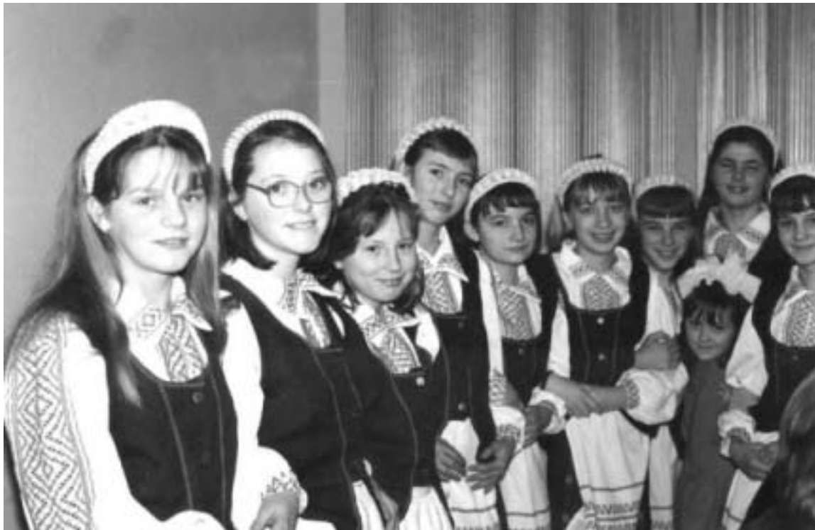
Хор «Сябрына». 2000 г.

падтрымкі з боку беларускай адміністрацыі. Не аднолькава ацэньваецца ў розных зямляцкіх арганізацыях і актыўная роля амбасады Рэспублікі Беларусь у жыцці зямляцкіх суполак Літвы і пашырэнні іх сеткі.