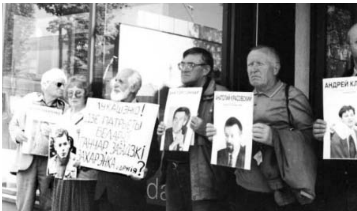
Пікет сябраў ТБК

ня нашых землякоў па інтарэсах, і геаграфічная разгалінаванасць іх суполак, і вельмі высокая актыўнасць на мяккі адрозніваць культуры, моў і менталітэтаў. Аднак — і вялікі сацыяльны дынамізм. Беларусы выяўляюць сябе практычна ва ўсіх галінах дзейнасці Літоўскай дзяржавы і рэпрэзэнтаваныя на ўсіх узроўнях грамадства. Таму для іх аб'ектыўна актуальныя праблемы, якімі жыве ўся краіна — ад геапалітычных пытанняў (уключаючы і нюансы памежнага і візавага рэжыму паміж дзвюма нашымі дзяржавамі) да маштаб-