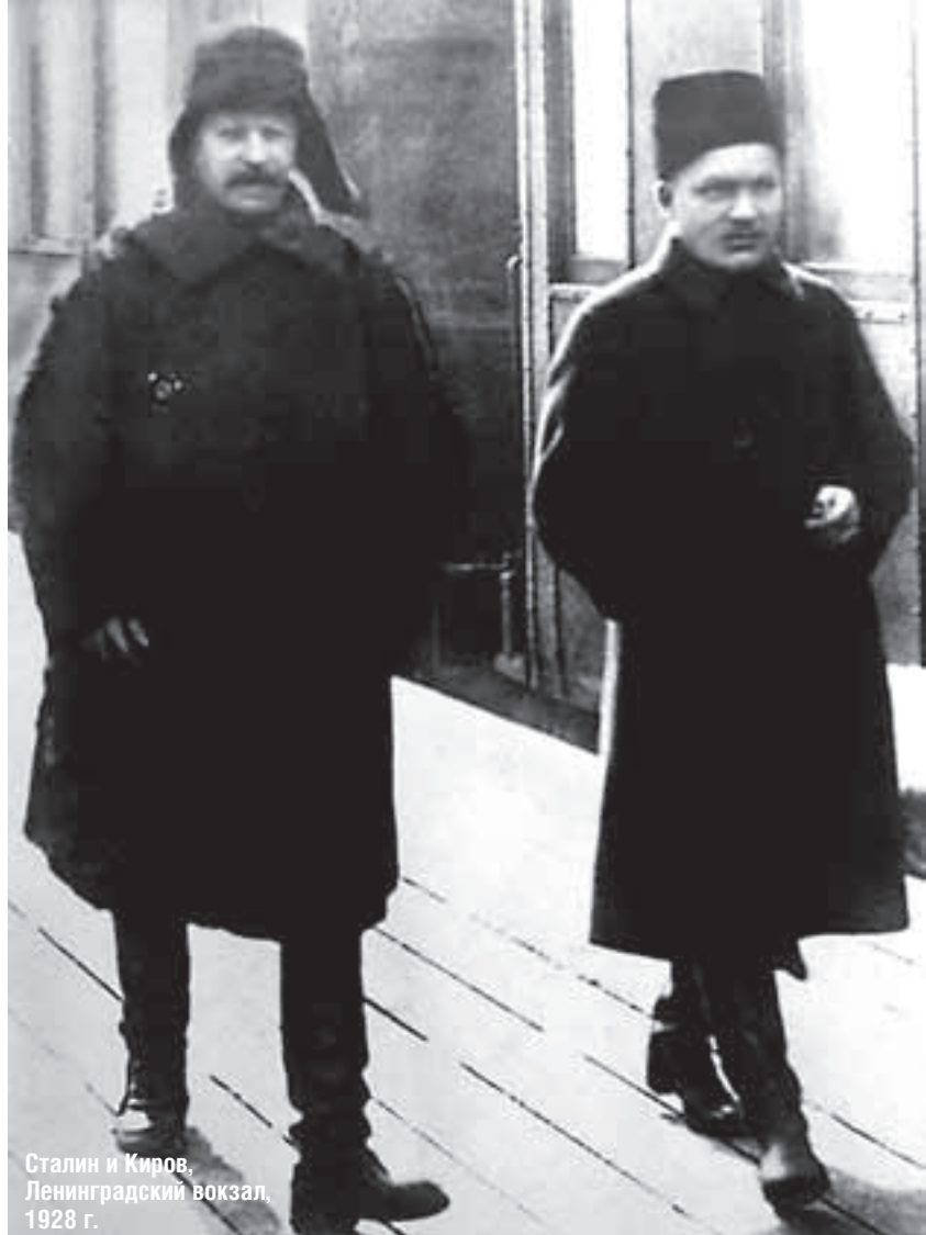
Сталин и Киров, Ленинградский вокзал, 1928 г.