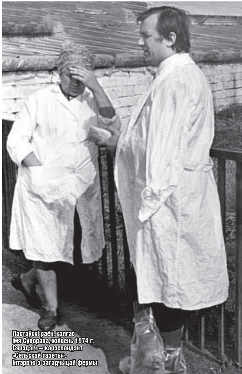
Пастаўскі раён, калгас імя Суворова, жнівень 1974 г. Сярэдзіч — карэспандэнт «Сельскай газеты». Інтэрв'ю з загадчыцай фермы

Тады я працаваў у аддзеле жывёлагадоўлі, сямі яшчэ не было, на пад'ём быў лёгкі. Накіравалі — паехаў. А палове шостаі раніцы з'явіліся мы з фотакорам на тым жывёлагадоўчым комплексе. Бачым: дзядзька нагрузіў сані дохлымі парасятамі, якія ноччу сканалі, і вязе да магільніка. Далей высветліў, што кормяць парасят не ўласнымі камбікармамі, а атрымліваюць іх па блаце на Ваўкавыскім