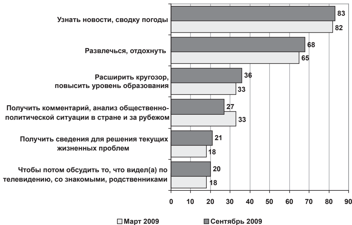
Рис. 1. Цели просмотра телепередач (возможно несколько ответов, %)

отдохнуть, развлечься. Преимущественно это женщины (57%). Здесь около половины — 48% — составляют граждане до 40 лет. Более активны в потреблении развлекательной телепродукции рабочие и крестьяне, ИТР и работники сферы обслуживания, торговли. Среди таких зрителей преобладают люди, проживающие в г. Минске и областных центрах.