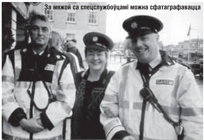
За мяжой са спецслужбоўцамі можна сфатаграфавецца

Асобная катэгорыя — кансультанты па вырашэнні канфліктных сітуацый. На кожнай акцыі такіх па 2–3 чалавекі, таксама ў адмысловай уніформе. «Іх галоўная функцыя — стрымліваць сваіх жа калег-паліцэйскіх ад ужывання сілы, у тым ліку і ў дачыненні да журналістаў», — тлумачыць А. Кён.