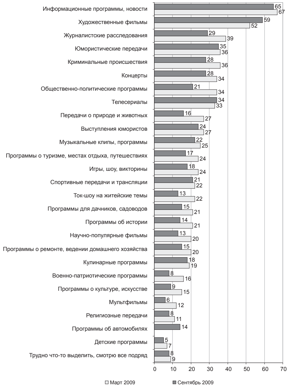
Рис. 2. Телепередачи, вызывающие повышенный интерес (возможно несколько ответов, в %)

Телесериалы также привлекают в основном женщин (80%). Но возрастные рамки здесь несколько иные. Сериалы любят смотреть люди в возрасте 55 лет и старше (35%). Эту благодарную аудиторию представляют люди с базовым образованием, работники сферы обслуживания, торговли и пенсионеры. А также жители сел нашей страны.