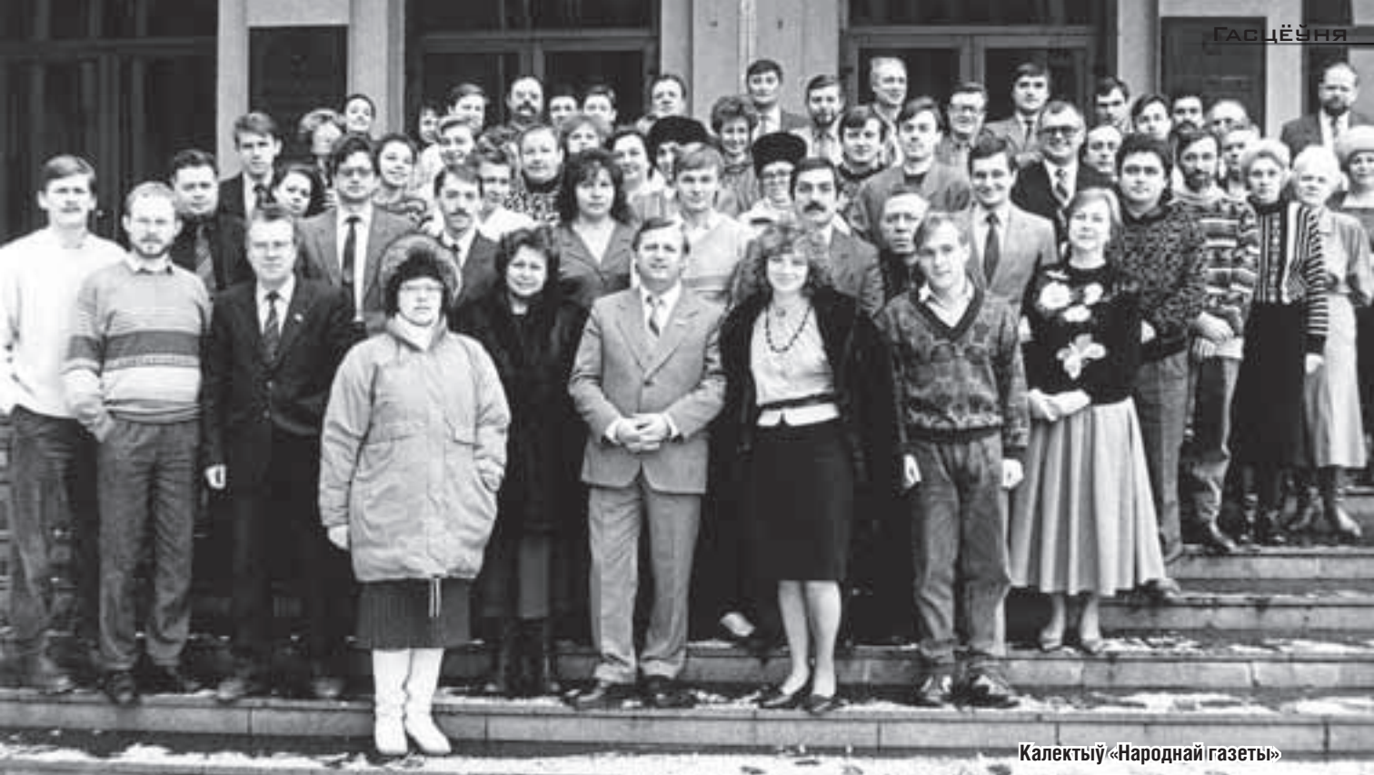
Калектыў «Народнай газеты»

камбикормавым заводзе. Самога дырэктара на месцы не аказалася, бо ён кінуўся ў Растоўскую вобласць, каб яшчэ адзін «перадавы» вопыт пераняць: Шавялуха яму давёў, што там трымаюць свіней і парсят увогуле ў намётах, і не трэба будаваць жывёлагадоўчыя комплексы.