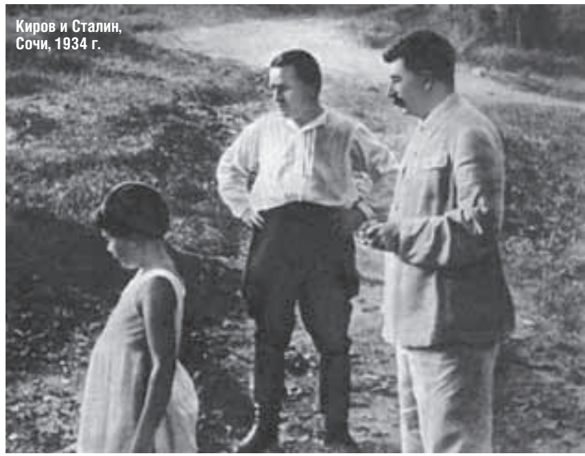
Киров и Сталин, Сочи, 1934 г.

«Шик С. Я., член партии с 1931 г., по социальному положению рабочий. В момент возникновения