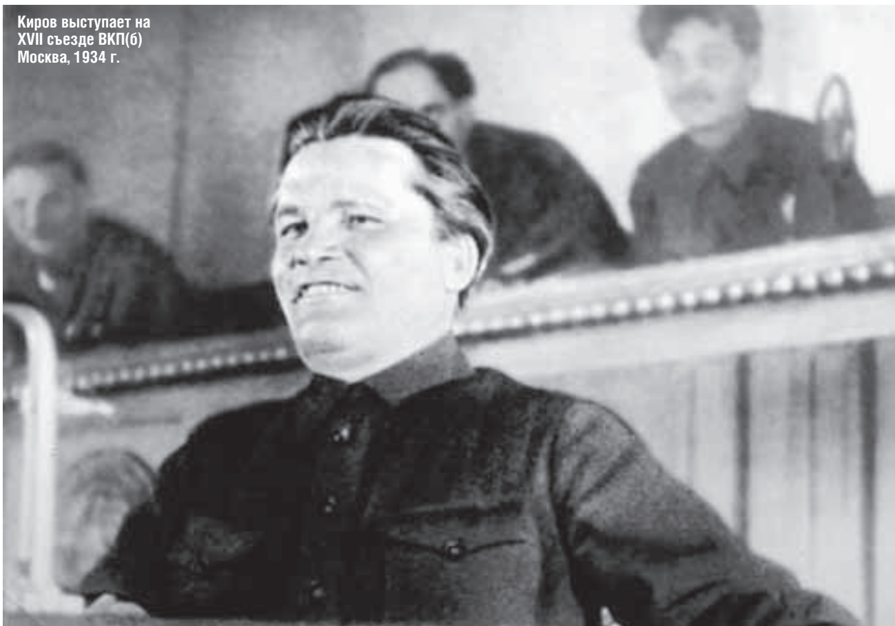
Киров выступает на XVII съезде ВКП(б) Москва, 1934 г.

Развернулась государственная истерия — как средство поддержания тонуса коммунистической империи.