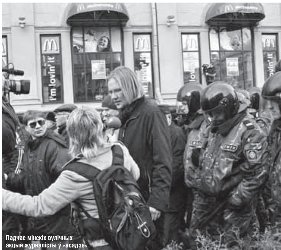
Падчас мінскіх вулічных акцый журналісты ў «асадзе»

Аднак ліст з ГУУС Мінгарвыканкама, на які спасылаецца МУС, у БАЖ з нейкіх прычын так і не дайшоў. Адказныя супрацоўнікі сцвярджаюць, што адправілі ліст яшчэ 9 кастрычніка, але пераслаць у БАЖ яго копію чамусьці адмаўляюцца і спасылаюцца на занятасць. Такім чынам, журналісты дагэтуль не могуць даведацца, якія вынікі дала тая «вычарпальная праверка».