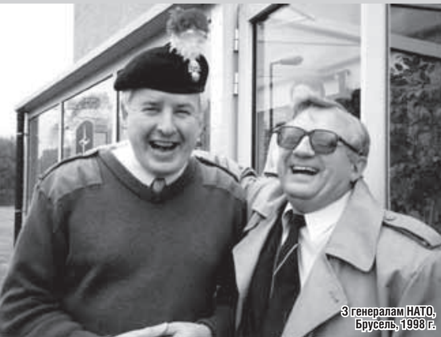
3 генералам НАТО, Брусель, 1998 г.

— Я верю в благоразумие белорусского народа, в его могучую волю, которая проявится, заняв место тупого терпения. Беларусь не может вечно быть на обочине мировой истории, где стремятся удержать ее нынешние власти. Наш народ добьется уважения к себе, своим правам и свободам. В том числе и к главной свободе — свободе слова, за которую я воюю всю свою жизнь.