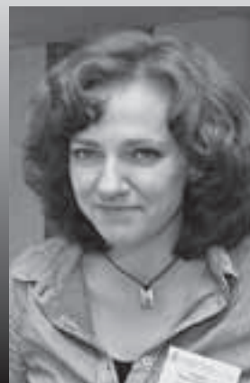
Вольга БАБАК, www.baj.by

Дыскусія пра новыя метады працы беларускай міліцыі з прэсай падчас вулічных акцый неўзабаве адышла на другі план. Між тым, з набліжэннем выбараў — спачатку мясцовых, а затым і прэзідэнцкіх — праблема ўзаемадачыненьняў сілавікоў і журналістаў будзе набываць усё большую актуальнасць.