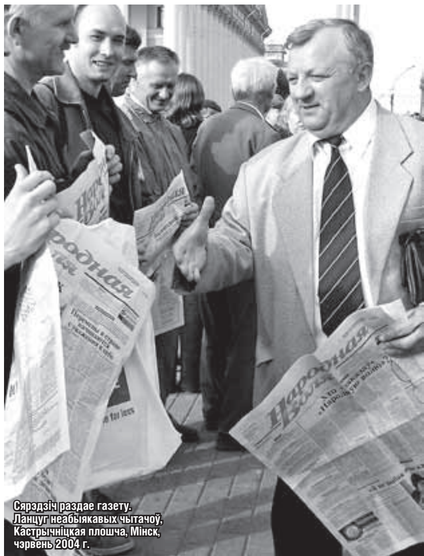
Сярэдзіч раздае газету. Ланцуг неаб'якавых чытачоў, Кастрычніцкая плошча, Мінск, чэрвень 2004 г.

— Згодны. Тэарэтычна ўсё слушна. Але ж трэба ўлічваць, што сёння людзі не атрымліваюць